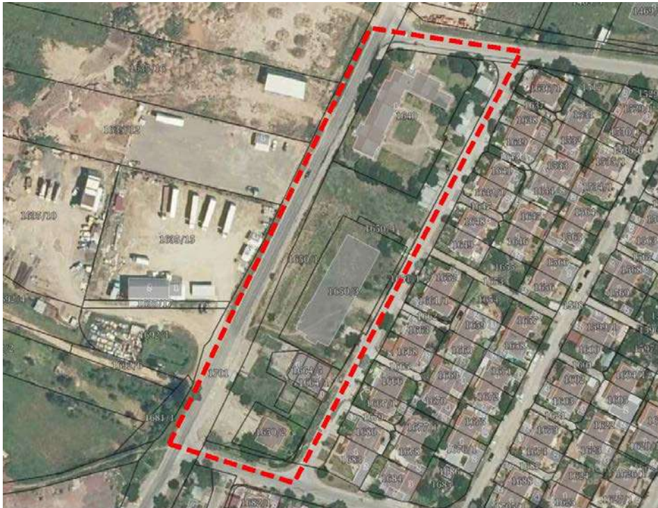
местоположба на плански опфат

Опфатот на Детален урбанистички план за дел од блок СИ 02.01, Општина Штип е сместен во периферниот дел на град Штип, во рамки на Општина Штип. Локалитетот претставува делумно изградено земјиште.