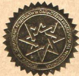
Проф. д-р Миле Димитровски дипл.маш.инж.

Претседател на Комората на овластени архитекти и овластени инженери