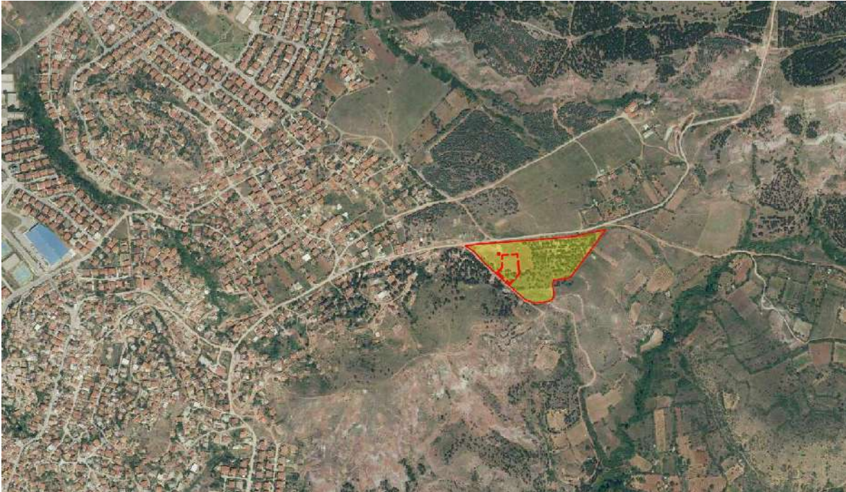
Граница на проектн опфат и КП756 на подлога од Гугл

Проектниот опфат се наоѓа во КО Штип вон град, Општина Штип и е надвор од опфатот на постоечка урбанистичка документација, а со самото тоа и нема дефинирана намена на земјиштето. Согласно потребите на инвеститорот и согласно Законот за урбанистичко планирање (Службен весник на РСМ бр.32/2020 год) како и Правилникот за урбанистичкото планирање (Службен весник на РСМ бр.225/2020, 219/2021), урбанистичка проектна документација, се предвидува да биде со намена А4 - ВРЕМЕН ПРЕСТОЈ . Урбанистичкиот проект кој е предмет на донесување треба да овозможи изградба на објекти од втора категорија на градба кои ќе овозможат сместување на околу четириесет фамилии од ранлива категорија.