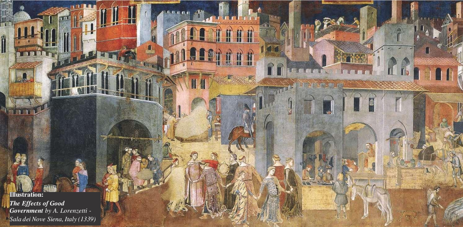
Illustration: The Effects of Good Government by A. Lorenzetti - Sala dei Nove Siena, Italy (1339)