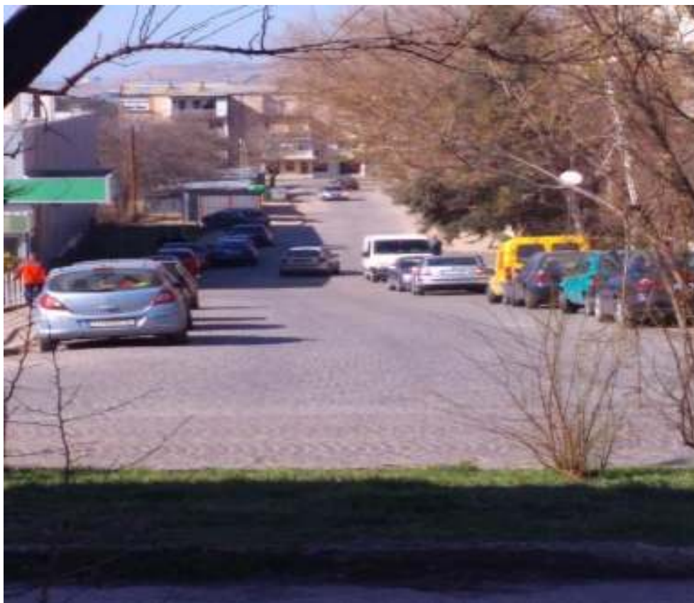
Слика 2. Локација на проектот каде ќе се изведуваат работи за реконструкција на постоечка улица „Браќа Даневи“, Општина Штип