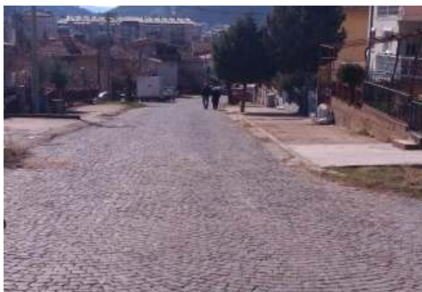
Слика 1 Локација на проектот каде ќе се изведуваат работи за реконструкција на постоечка улица „5ти Конгрес“, Општина Штип